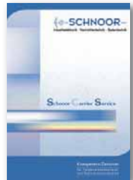
Schnoor Carrier Service