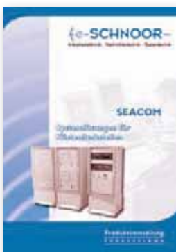
SEACOM Systemlösungen für Funkanlagen