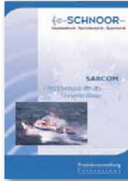
SARCOM Systemlösungen für die Seenotrettung