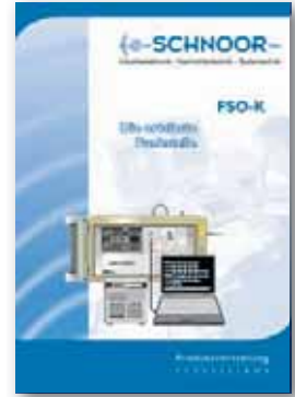
FSO-K Ortsfeste Funkanlagen