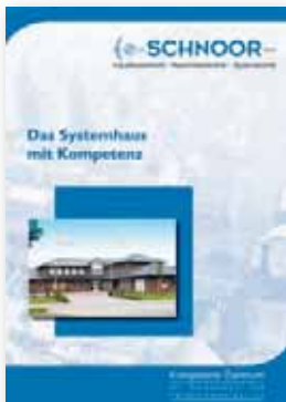
Ein Systemhaus mit Kompetenz