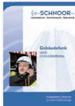
Gebäudefunk nach BOS-Richtlinien