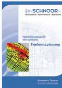
Funkfeldmessung für eine optimale Funknetzplanung